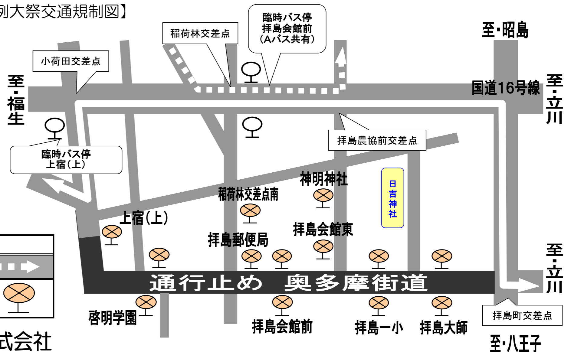
【日吉神社例大祭交通規制図】